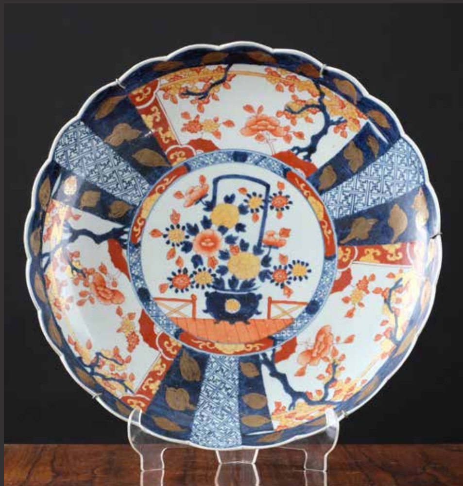
197. Beau plat en porcelaine Imari dans les tons corail, marine et or à bordure festonnée. Il est orné d'un cartouche central en médaillon représentant une urne en fleurs, encadré de trois grandes cartouches à décor d'arbres en fleurs. Restauration mineure. Japon, XIXème Diam: 43cm