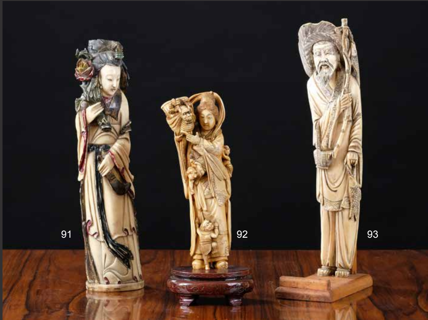
91. Statuette en ivoire chinois. Femme à la fleur. Rehauts colorés. Chine, XIXème H: 24cm