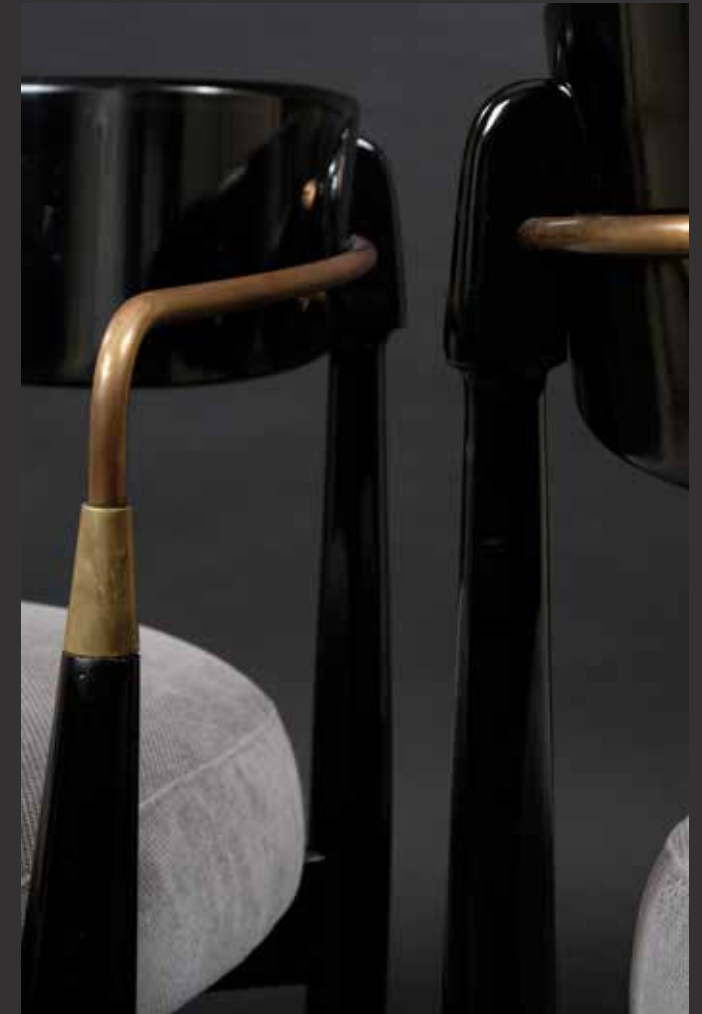
96. Paire de petits fauteuils des années 70. Design Dan Johnson. Ils sont en bois laqué noirci à dossier incurvé traversé à l'arrière par une tige de métal doré formant accoudoirs. Piétement fuselé. Tapissage de velours gris bleuté. $ 1,500/2,000