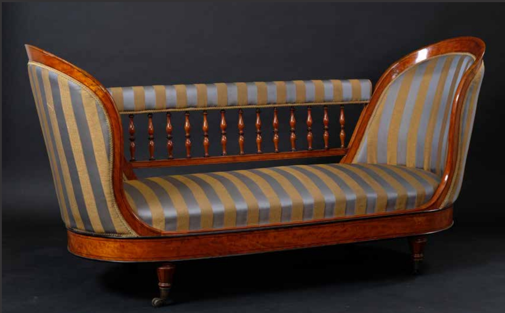
177. Canapé en bois d'acajou blond à double dossier latéral en alcôves reliées par un dossier droit à balcon droit à balcon de fines colonnettes. Tapissage de satin rayé bleu et or. France, époque Charles X