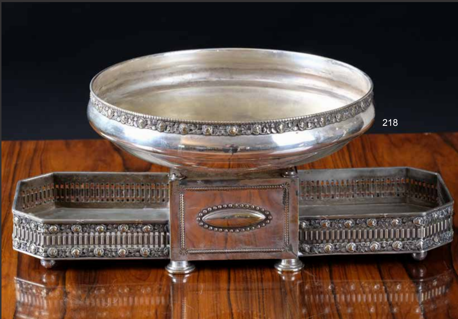
217. Plat ovale en métal argenté Christofle modèle Rubans Croisés