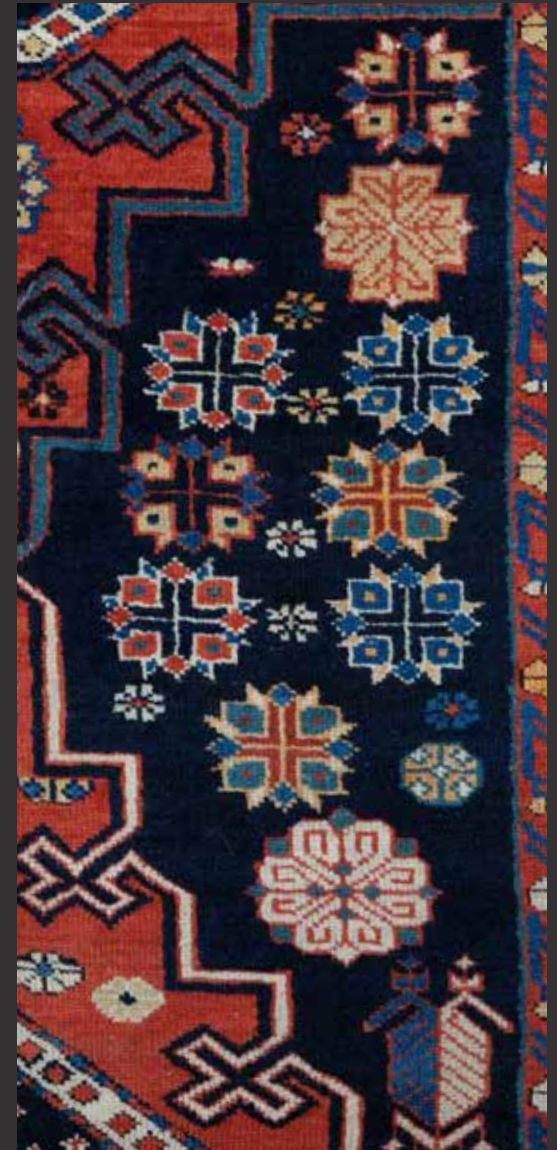
44. Long tapis Chirwan Konakend ancien. Il est à décor de trois grands médaillons en losanges crénelés corail de rosaces. chacun à médaillon central marine. Parterre marine à décor Bordure ornée de rosaces étoilées sur fond blanc L: 398cm, l: 143cm