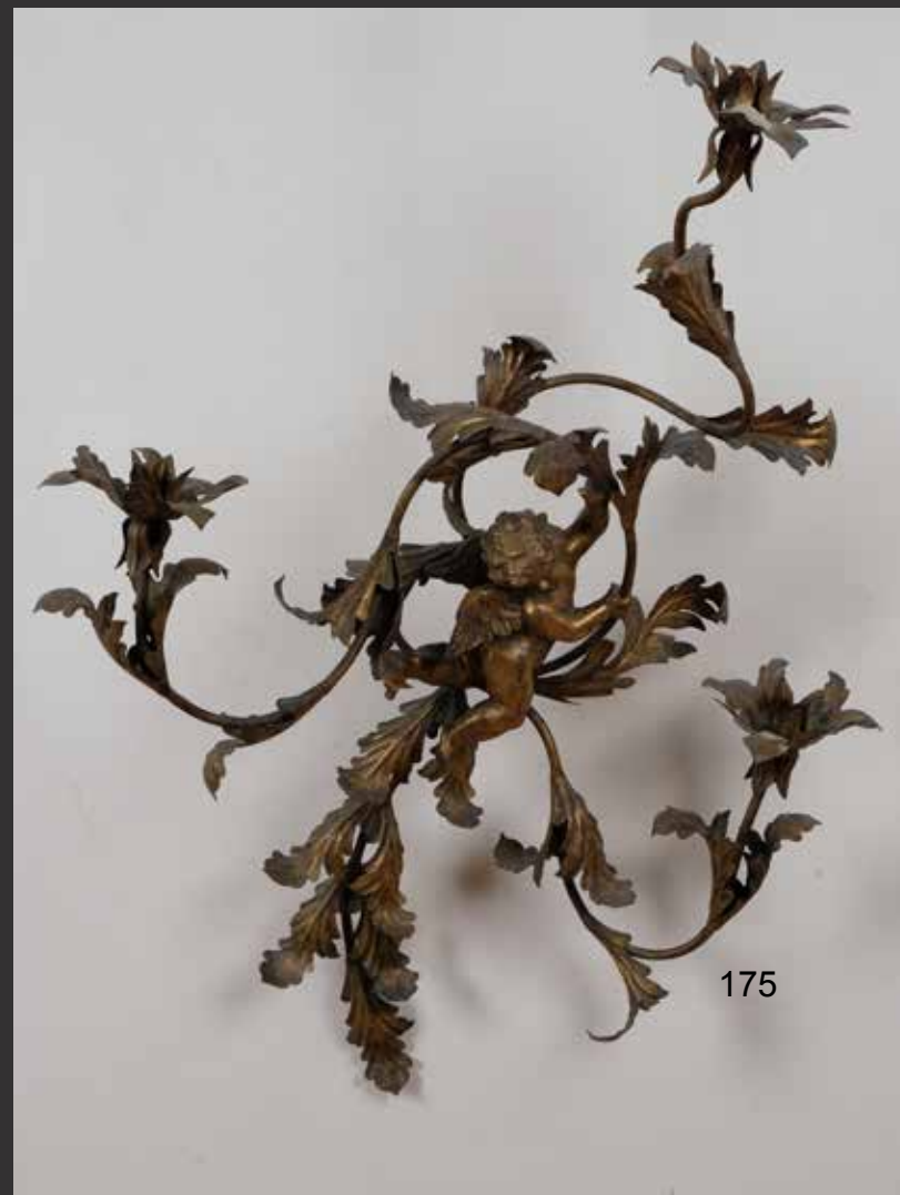
175. Applique murale en métal doré de style Louis XV à décor d'angelots et branchage. Europe H: 90cm