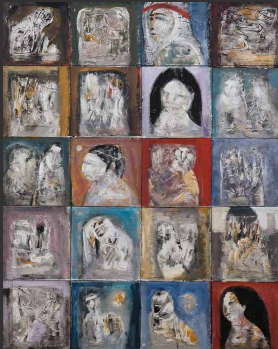
97. FIKRET OZTURK (Turquie. Né en 1961) Roman Group Mixed Media sur toile. Signée à l'arrière H: 100cm, L: 80cm $ 1,500/2,000