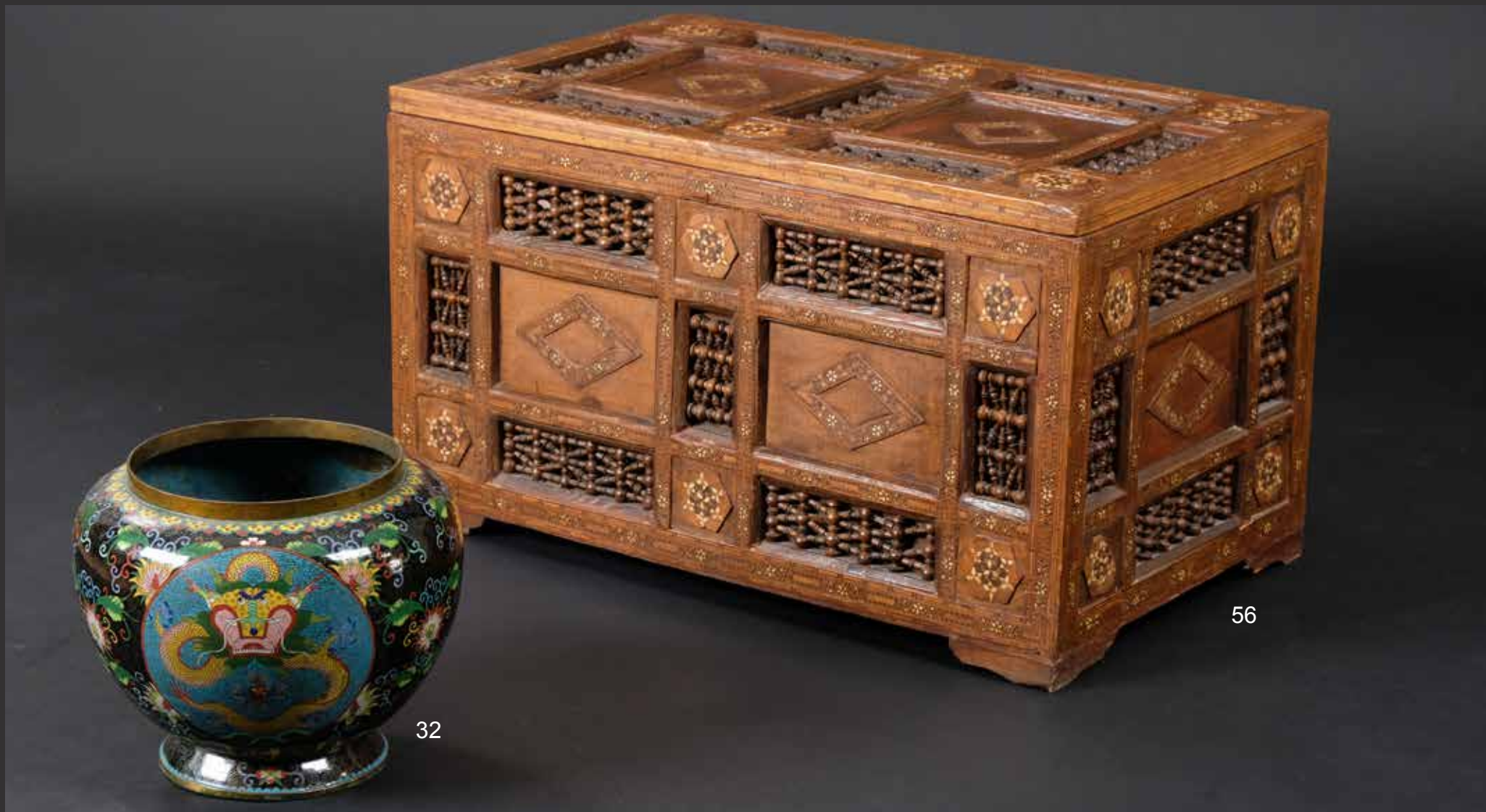
56. Coffre arabe formant table basse en bois sculpté de moucharrabieh et orné de rosaces marquetées de bois divers et os sur toutes ses faces. Syrie, XIXème L: 74cm, Pr: 45cm, H: 44cm