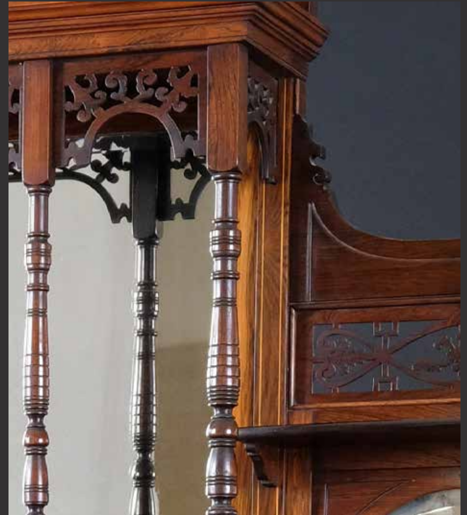
84. Beau meuble d'apparat victorien à multiples étagères et colonnettes orné d'une riche et élégante marqueterie en médaillons et losanges de bois clair. Le corps inférieur ouvre à deux battants encadrant une niche sur fond de miroir. Tablette inférieure d'entretoise à galerie de colonnettes. Angleterre, XIXème L: 145cm, Pr: 40cm, H: 195cm $ 2,500/3,000