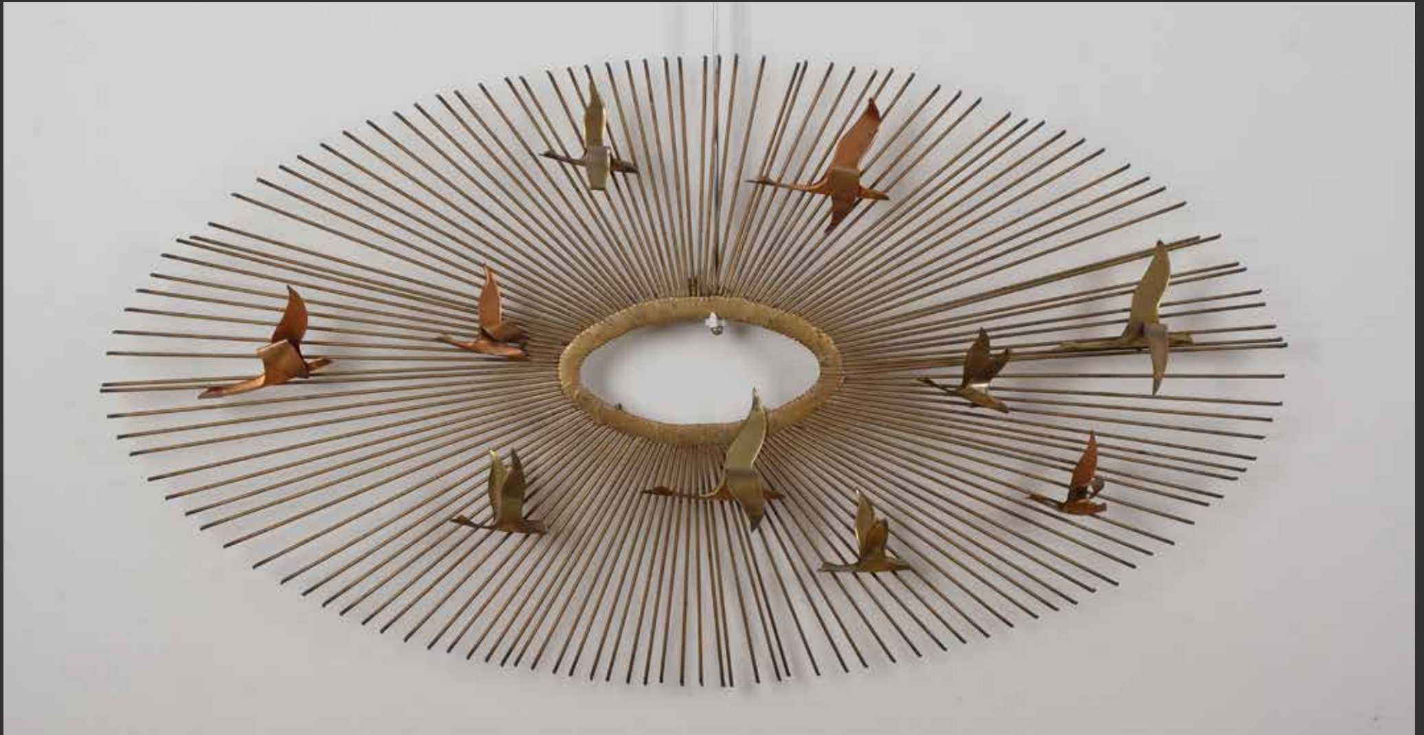
30. CURTIS JERE (Etats-Unis) Oiseaux au soleil Sculpture murale en métal doré H: 50cm, L: 90cm