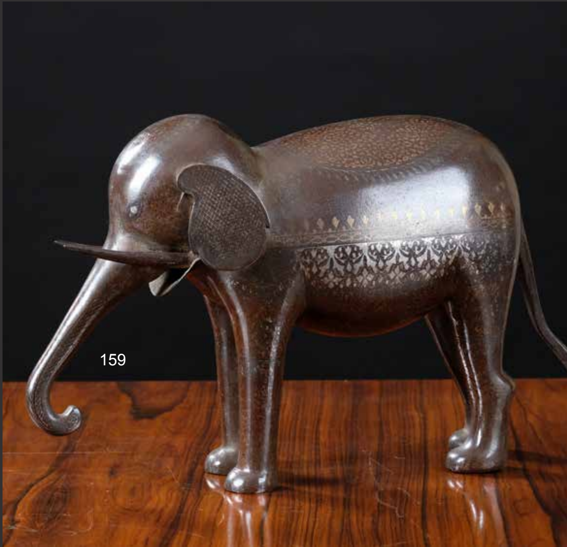
159. Bel éléphant Kajar ancien en métal patiné à décor palmettes et feuillage argenté et doré. Iran