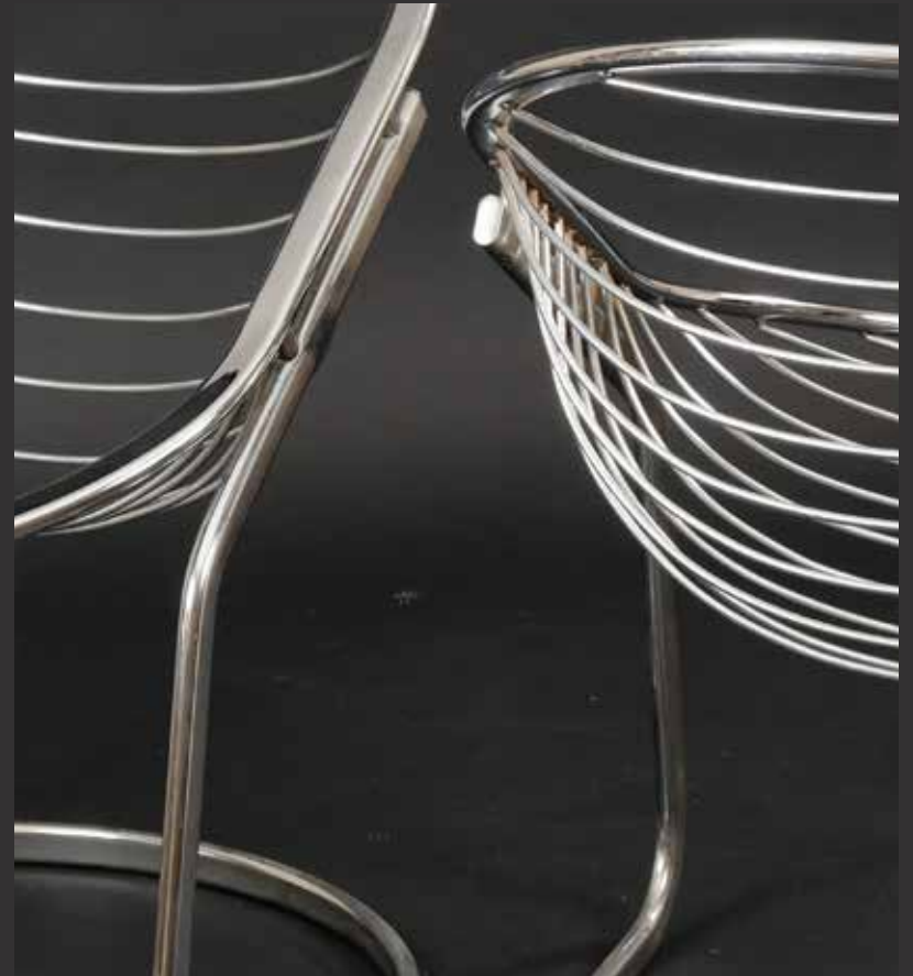
134. Paire de fauteuils en chrome design des années 70 à corps en coquille. Italie