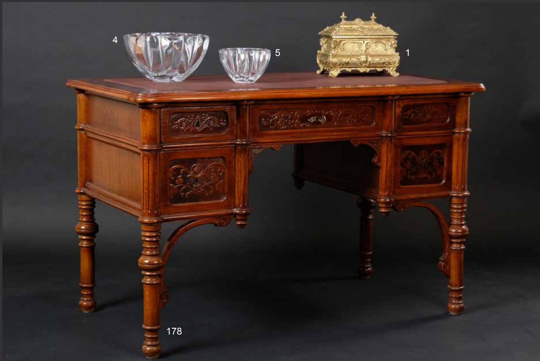
178. Bureau dans le goût Thonet à dessus de cuir grenat. Il ouvre à un grand et quatre petits tiroirs sculptés d'entrelacs et volutes. Piétement colonnes à bagues et cannelures. Autriche. Design Jacob & Josef Kohn. Circa 1900 L: 116cm, Pr: 64cm, H: 76cm $ 2,000/3,000