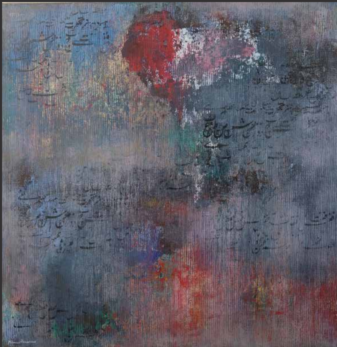
40. MAHMOUD ANSARI, 2016 (Irak. Né en 1985) Composition aux calligraphies Huile sur toile. Signée et datée en bas à gauche H: 120cm, L: 120cm