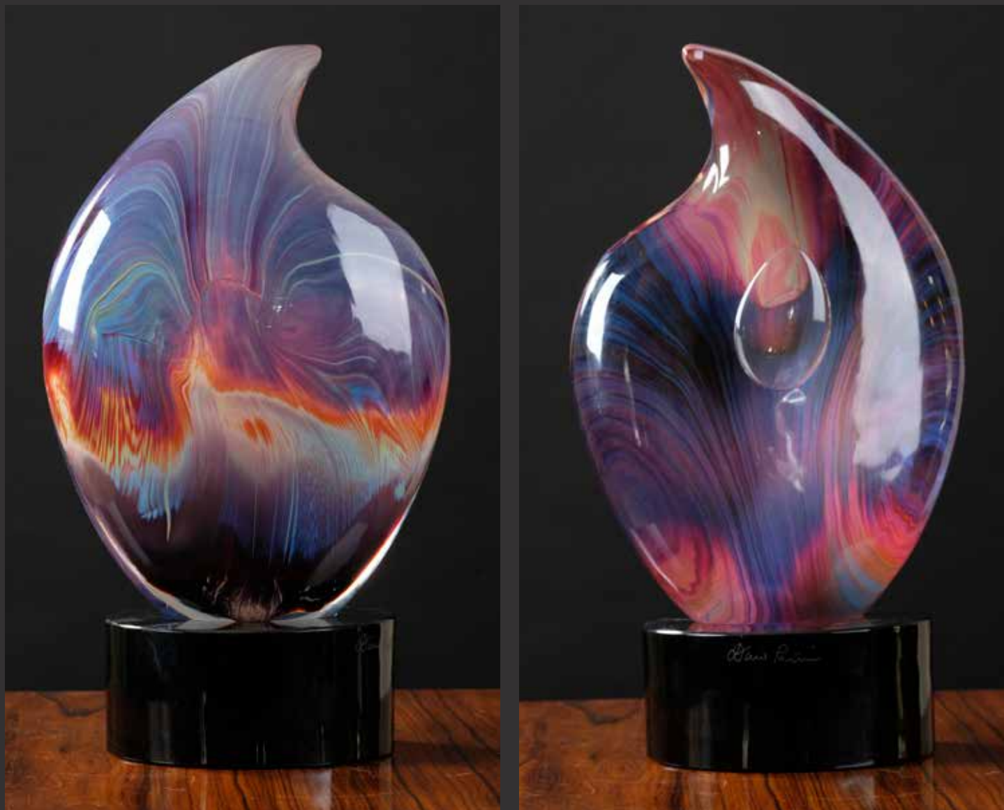
110. Bel élément en cristal italien en forme de goutte d'eau irisée. Multiples couches internes de cristal polychrome dans les tons mauve et rose. Sur socle cylindrique en cristal noir. Signé. Italie $ 1,200/1,500