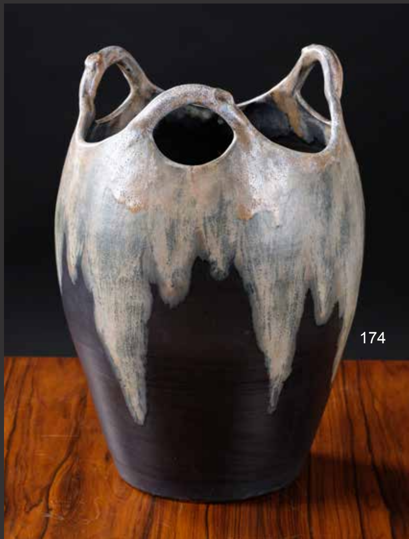
174. Vase en céramique émaillée à trois anses de forme balustre. Signé au bas Lebret H: 35cm