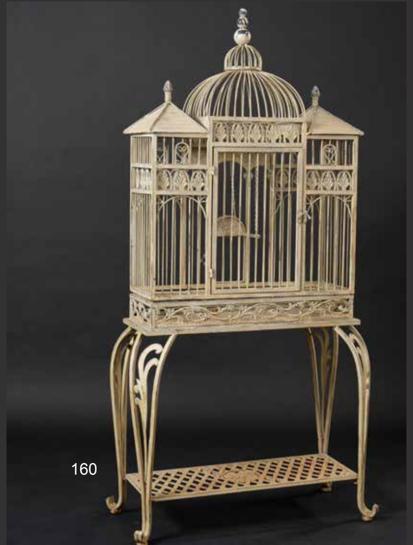
160. Charmante cage à oiseaux sur pieds en fer forgé laqué blanc. Sur piétement galbé relié par une tablette d'entretoise en treillis. France