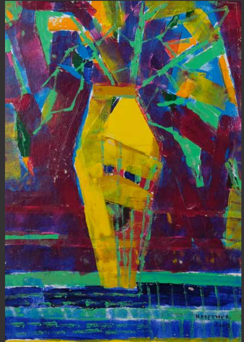
66. NAZEM MEZHER, 2009 (Né en 1965) Vase à fleurs sur fond mauve Acrylique sur carton. Signée et datée en bas à droite H: 70cm, L: 47cm $ 800/1,200