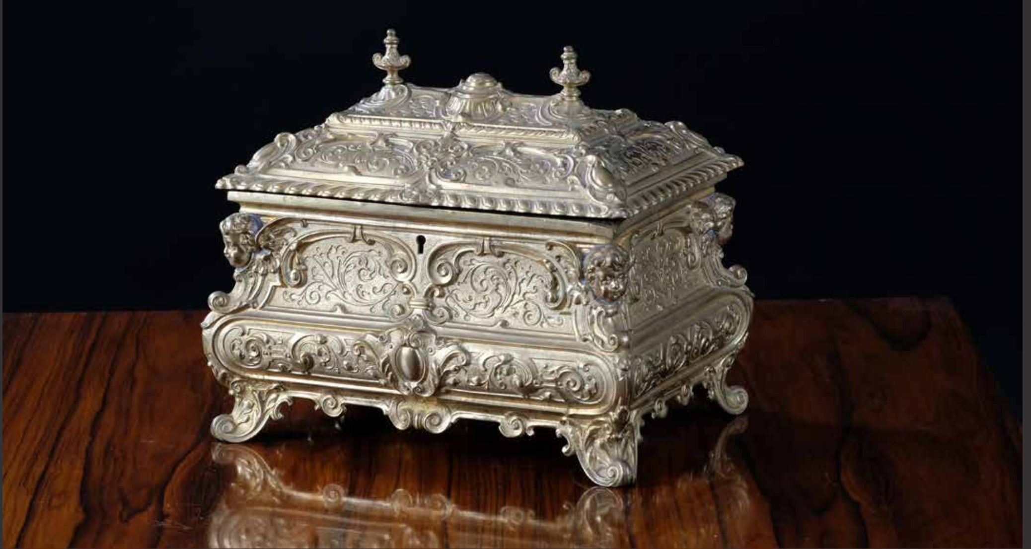
1. Beau coffret sur pieds de style Louis XV en bronze finement ciselé en relief d'entrelacs, volutes et angelots. Europe L: 25cm, H: 20cm $ 600/900