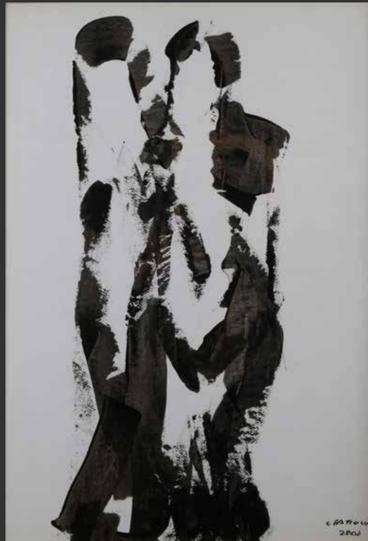
141. CHUCRALLAH FATTOUH, 2000 (Né en 1956) Deux silhouettes Aquarelle sur carton. Signée en bas à droite H: 70cm, L: 45cm $ 1,200/1,800