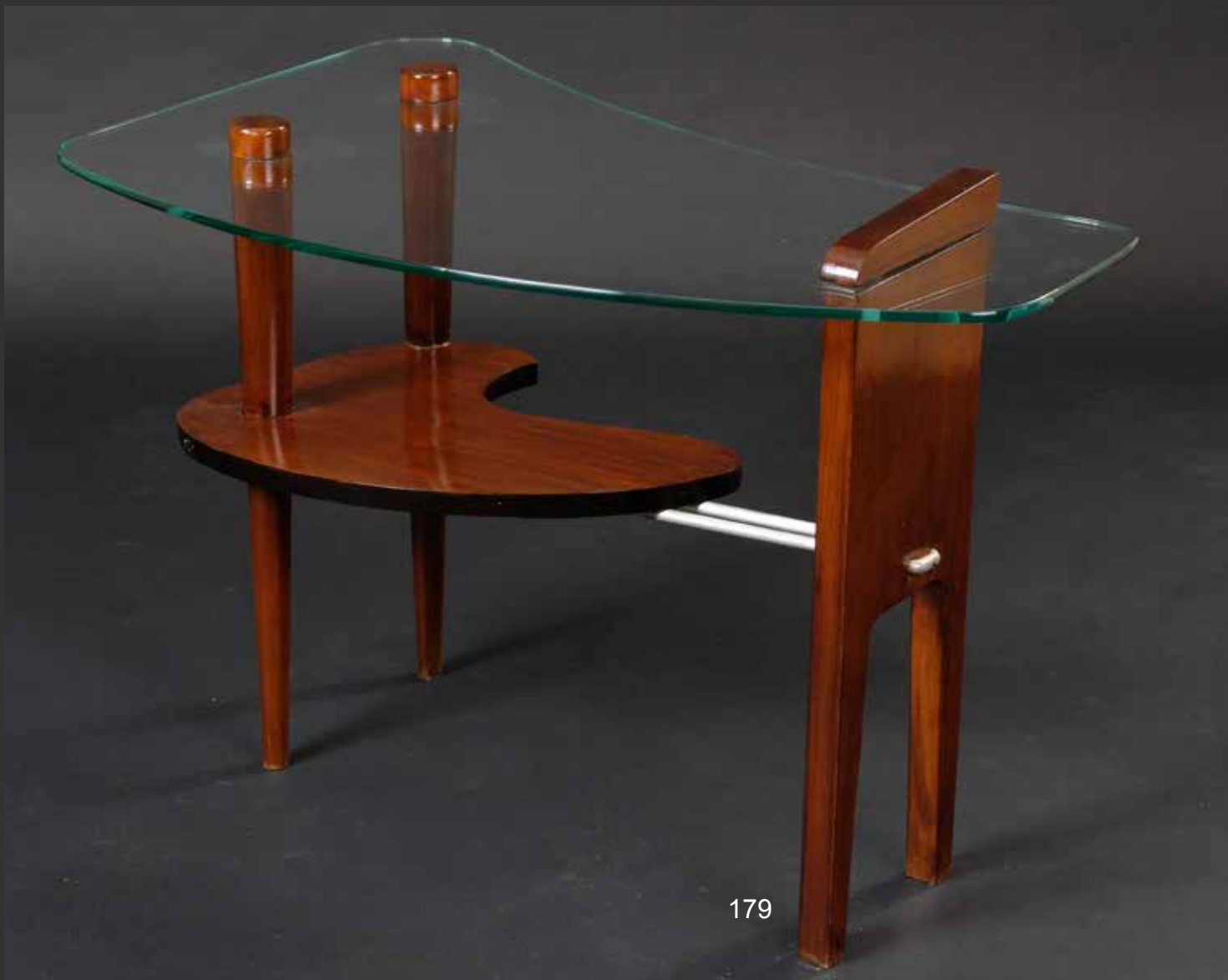
179. Petite table basse de forme haricot. Design des années 50. Dessus de cristal et tablette d'entretoise en forme de palette de peintre. Piétement fuselé L: 80cm