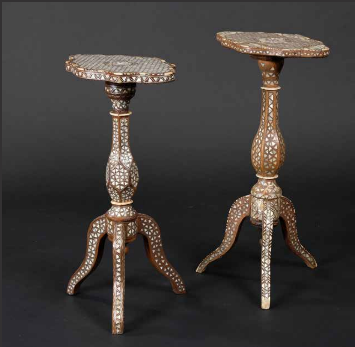
57. Deux petites sellettes arabes ovales sur piétement long. Elles sont ornées d'un décor marqueté de nacre et os. Quelques manques. Syrie, XIXème L: 30cm, H: 56cm