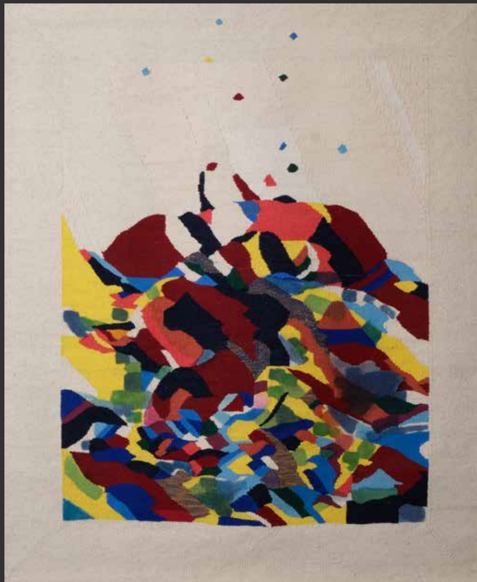
47. Tapiserie murale. Laine et coton haute lice. Signée Jaserka Tucan-Vaillant. Datée 5/9/2009 H: 115cm, L: 141cm $ 600/1,000