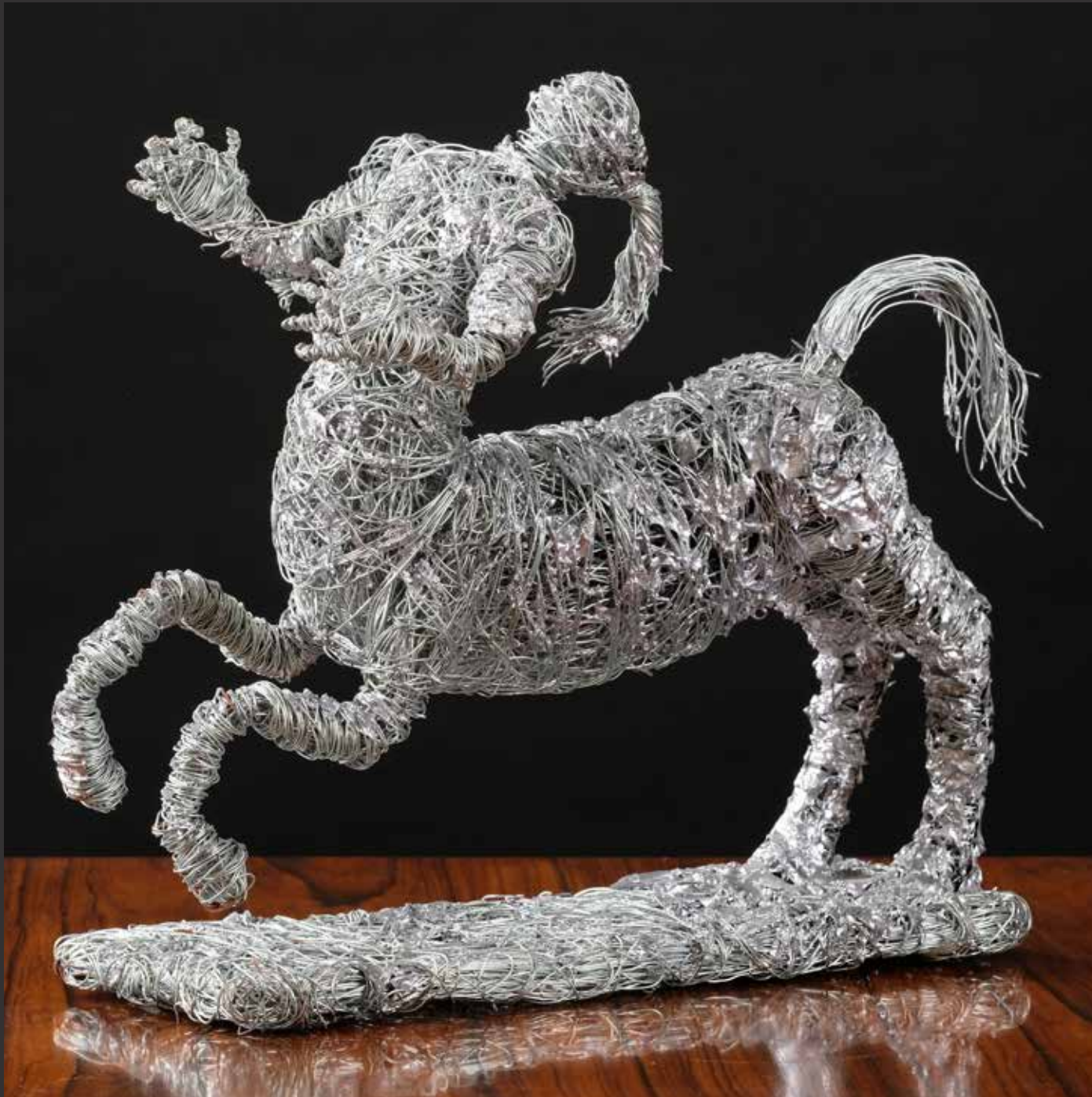
10. JORINE HAMD AOUI, 2015 Centaure féminin Sculpture en fils de fer L: 34cm $ 400/600