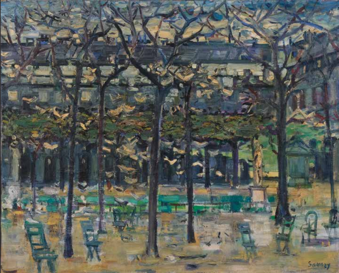
123. SAVARY Jardin du Luxembourg Huile sur toile. Signée en bas à droite H: 64cm, L: 80cm