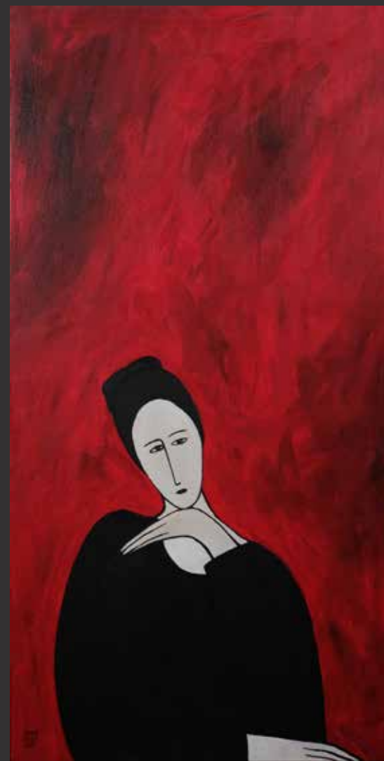
46. ZENA ASSI, 2003 (Née en 1974) Femme pensive sur fond rouge Huile sur toile. Signée et datée en bas à gauche H: 120cm, L: 60cm $ 2,000/3,000

Un certificat d'authenticité émis par l'artiste sera remis à l'acquéreur.