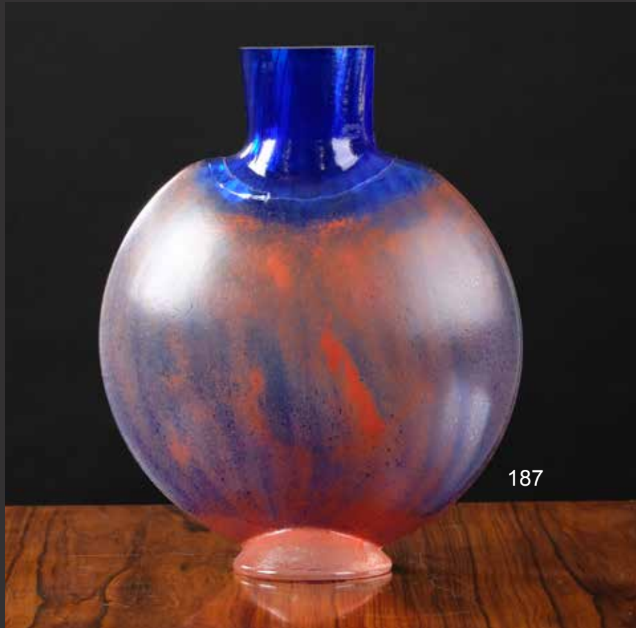
187. Beau vase en cristal Kosta Boda. Corps en gourde aplatie et col droit dans les tons bleu et corail H: 33cm