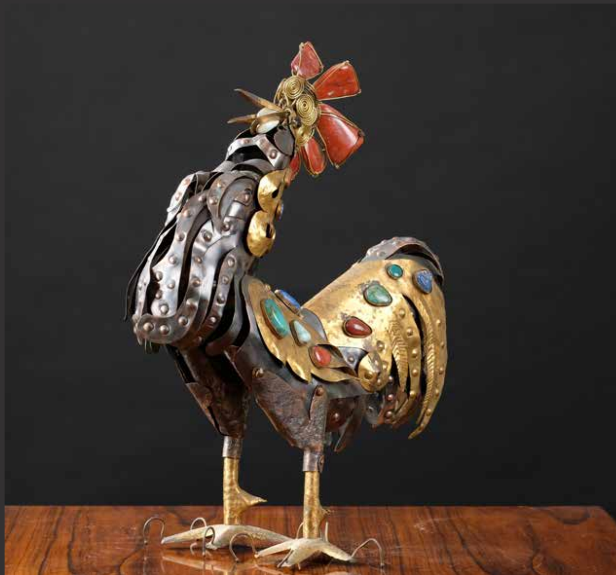
164. Beau coq en métal articulé. Avec incrustations de pierres dures semi précieuses diverses. Chili H: 44cm