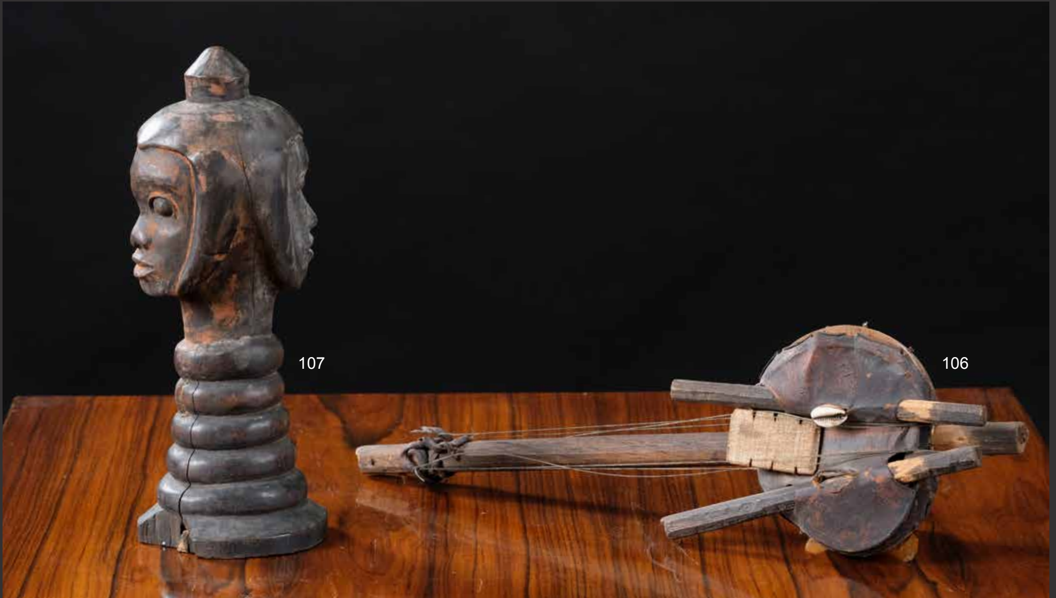
106. Instrument de musique à cordes africain ancien