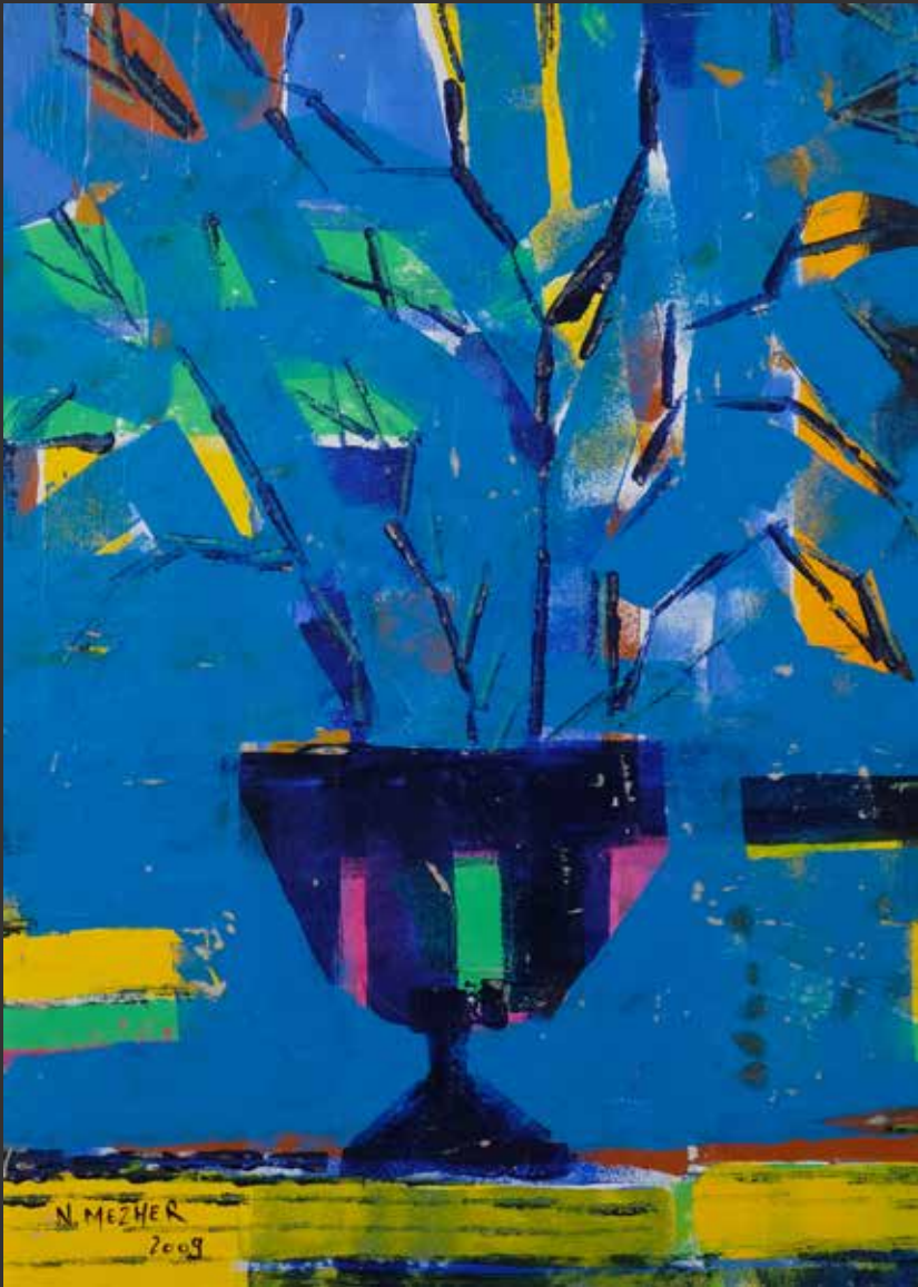
65. NAZEM MEZHER, 2009 (Né en 1965) Coupe à fleurs sur fond bleu Acrylique sur carton. Signée et datée en bas à gauche H: 70cm, L: 47cm $ 800/1,200