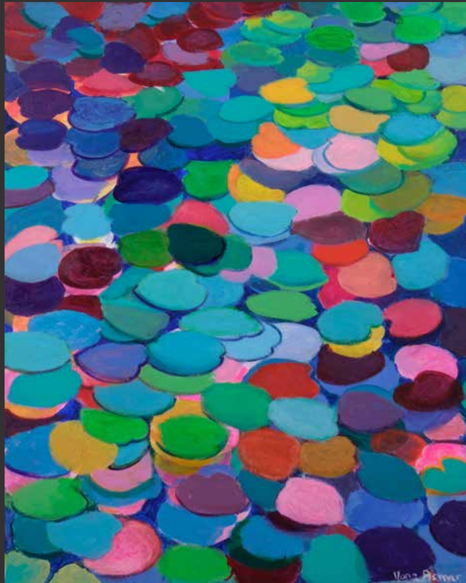
14. MONA ASMAR HECKER (Née en 1948) Nénuphars Acrylique sur toile. Signée en bas à droite H: 100cm, L: 80cm $ 1,000/1,300