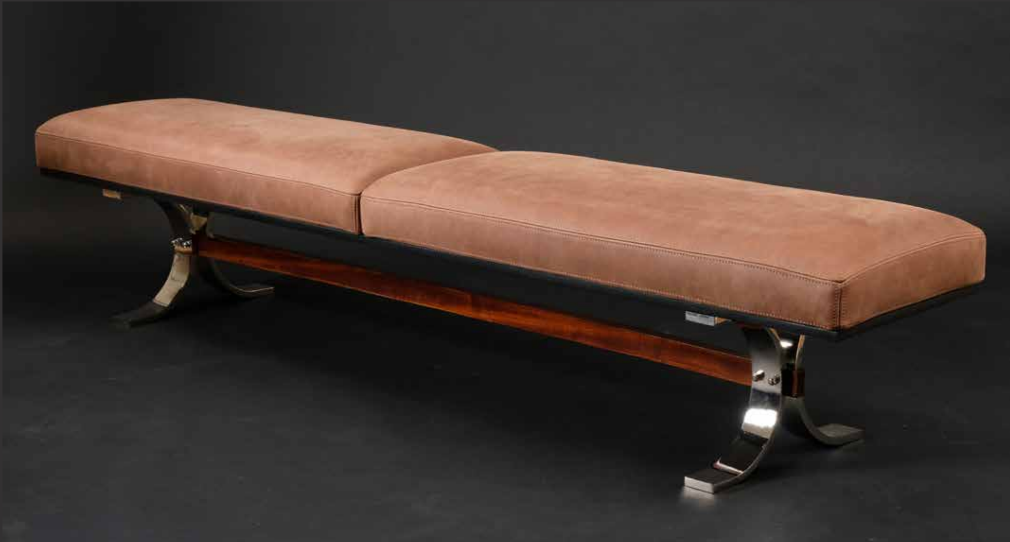
43. Longue banquette à double siège des années 70. Le piétement en chrome est relié par une baguette de bois. Tapissage de cuir marron L: 200cm