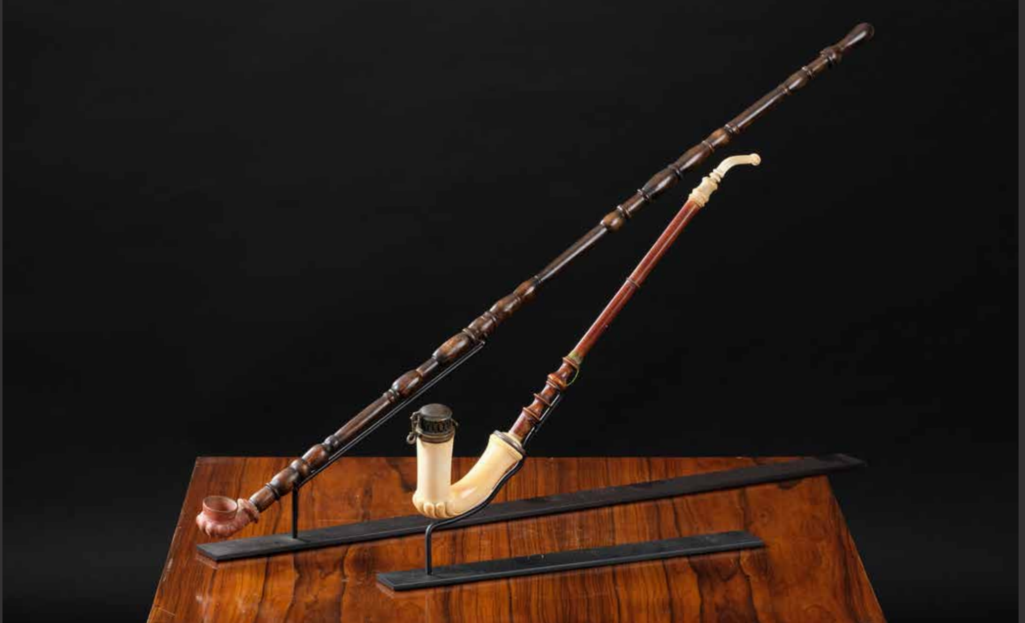
72. Deux grandes pipes à opium. L'une à long tuyau en bois noir à bagues et foyer en terre cuite taillé de godrons. L'autre, coudée, à tuyau en bois avec foyer et bec en os sculpté. Le couvercle du foyer en métal ciselé est rabattable $ 300/400