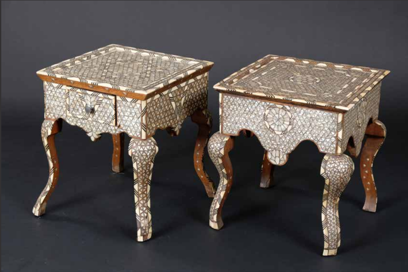
58. Paire de guéridons arabes bas à plateau carré. Ils sont à riche décor marqueté de nacre et os. Ils ouvrent à un tiroir en ceinture. Syrie, XIXème L: 35cm, H: 40cm