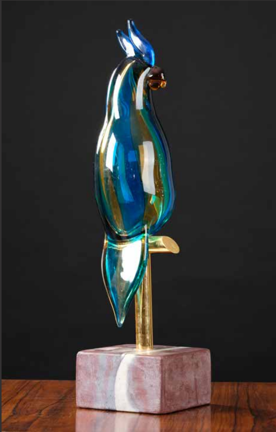
116. Beau perroquet en cristal Murano Zanetti. Monté sur un perchoir en métal doré reposant sur un cube de marbre H: 46cm $ 1,200/1,500