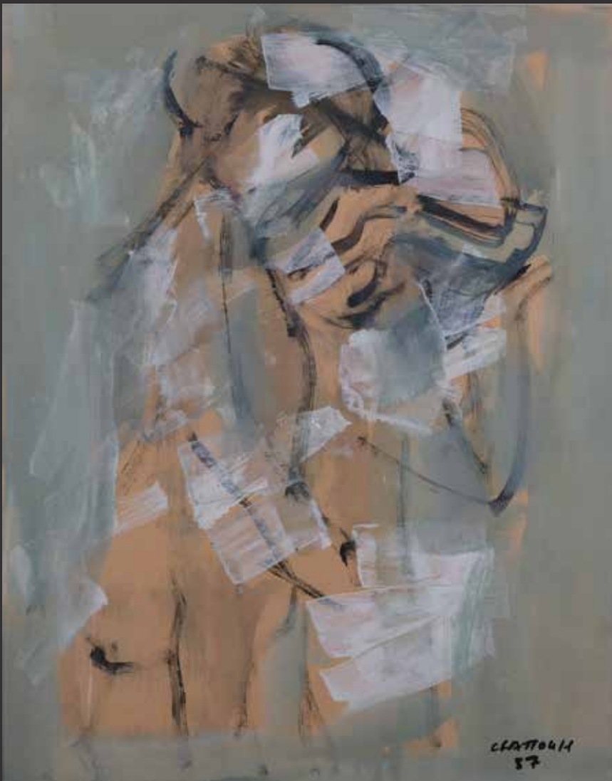
140. CHUCRALLAH FATTOUH, 1987 (Né en 1956) Silhouette Gouache sur carton. Signée et datée en bas à droite H: 52cm, L: 40cm $ 800/1,200