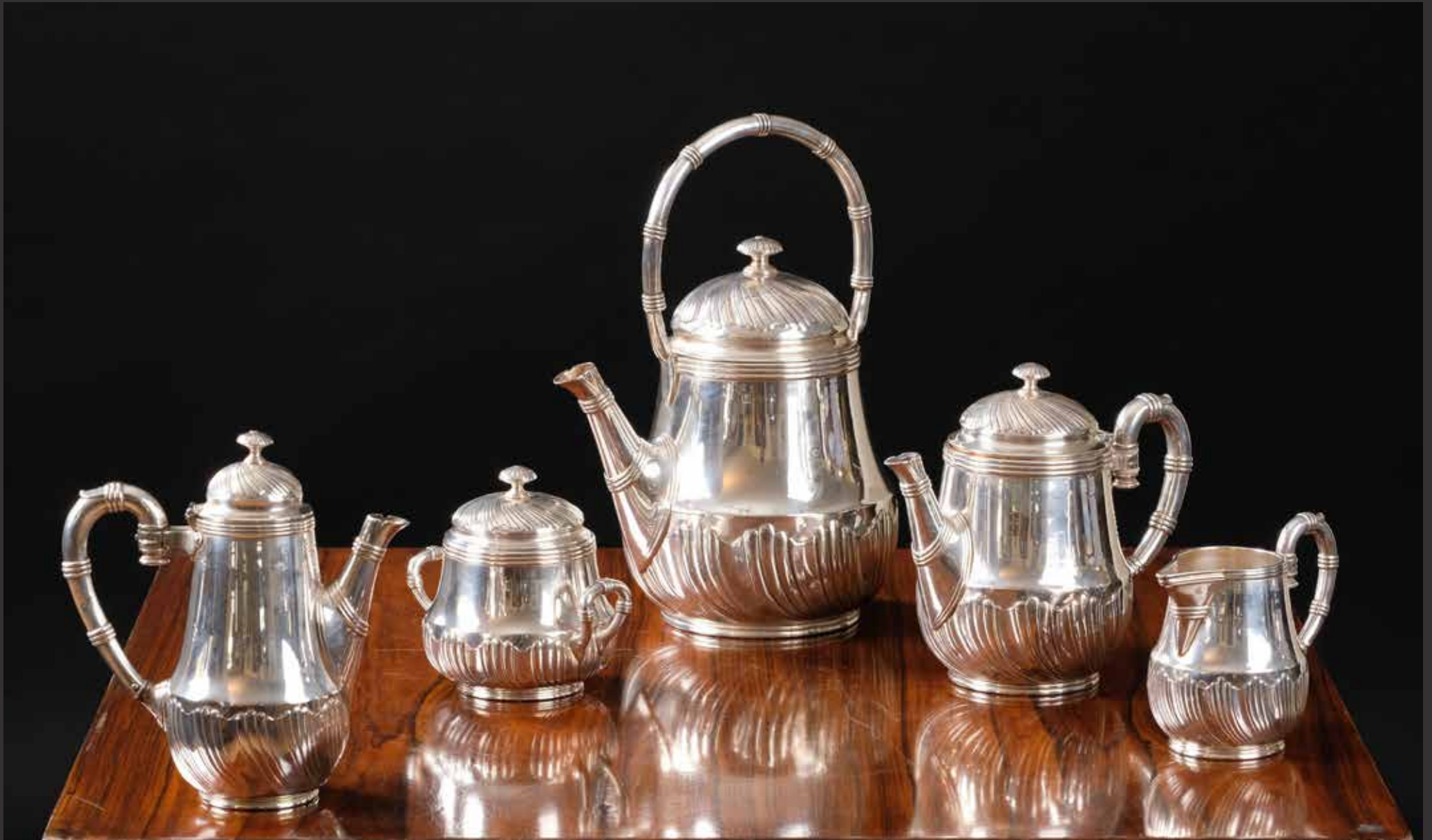
39. Élegant service à thé en métal argenté Christofle à ciselure de cannelures couchées. Il comprend une théière, une cafetière, un pot à eau, un sucrier et un pot à lait. France $ 2,000/2,500