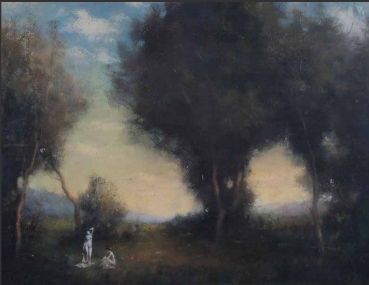
42. BALINT Paysage Pastel sur carton. Signé en bas à droite H: 37cm, L: 50cm