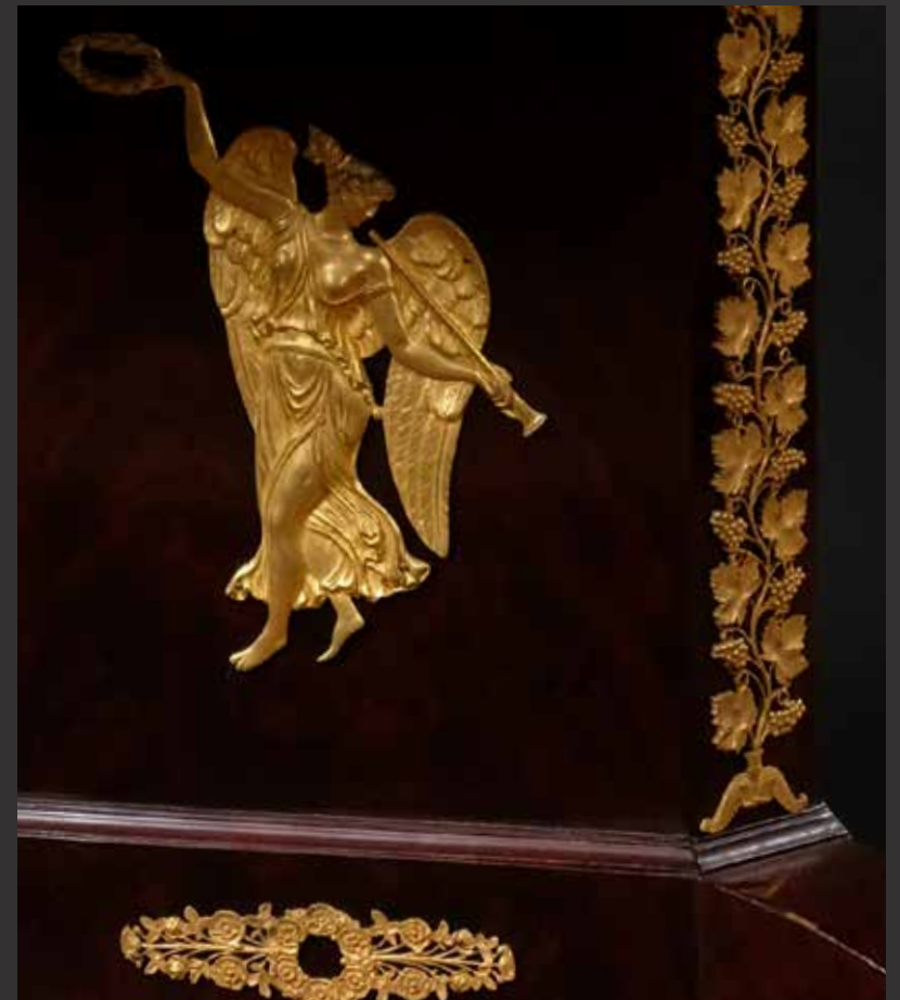
150. Grande table de centre de style Empire en bois et placage d'acajou flammé. Le plateau rond repose sur un important piétement triangulaire reposant sur trois pieds cambrés. Très riche ornementation de bronze ciselé en feuilles de vigne et musiciennes. Sabots de bronze en pattes de lion. France, XIXème Diam: 110cm, H: 76cm $ 2,000/3,000