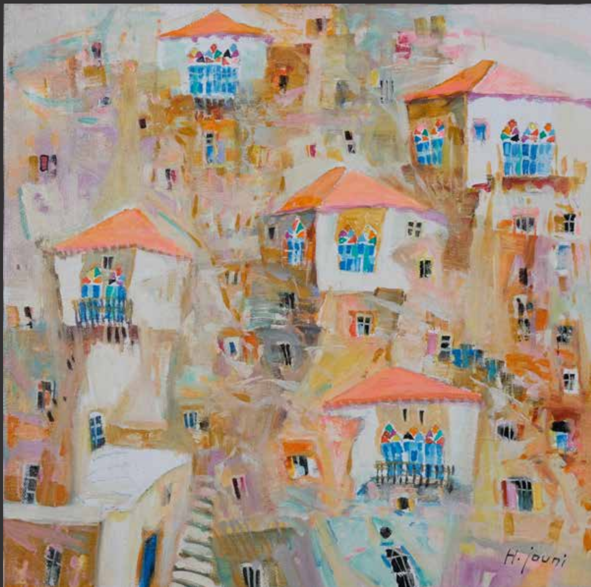
18. HASSAN JOUNI, 2010 (Né en 1942) Les toits de Beyrouth Huile sur toile. Signée en bas à droite H: 40cm, L: 40cm